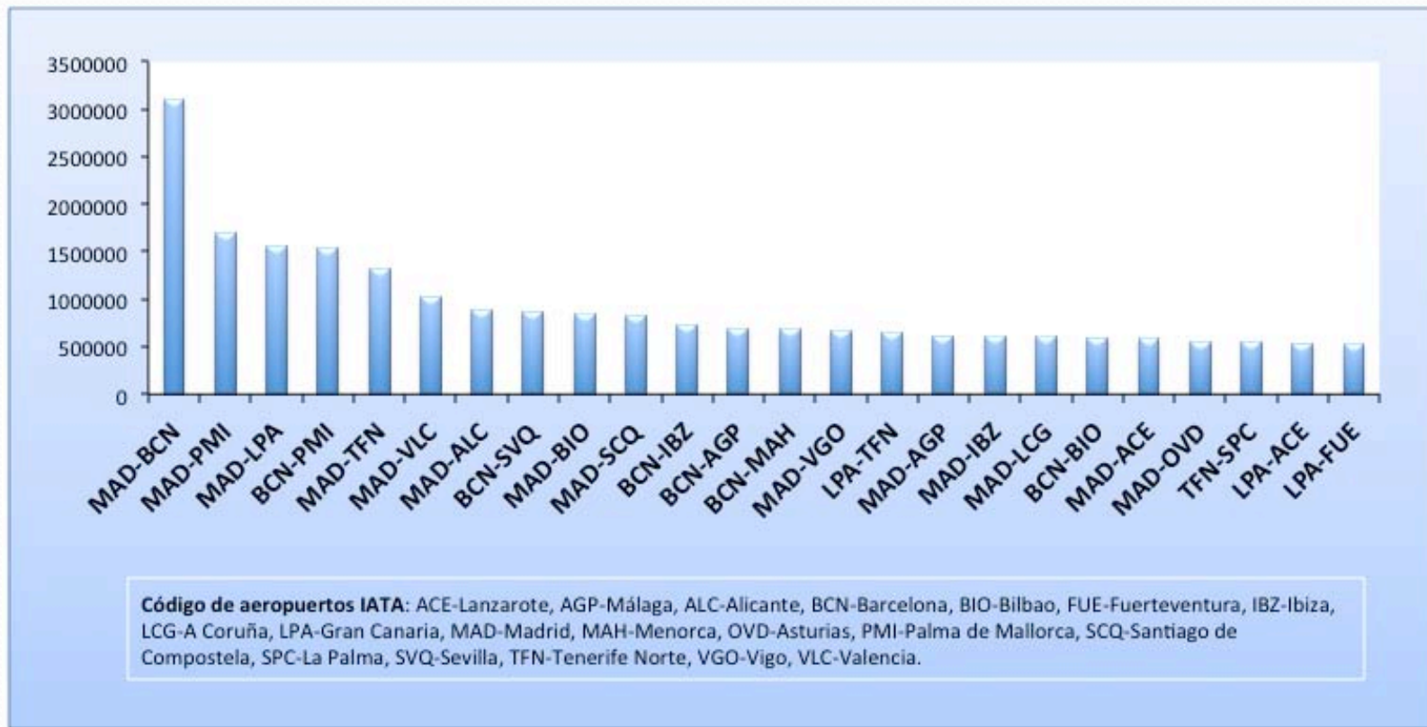
Gráfico 1: Rutas nacionales con al menos 500.000 pasajeros (2010)